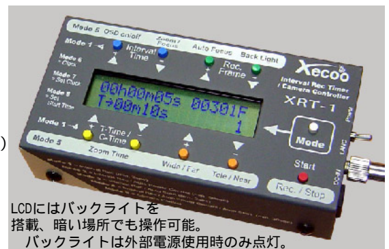
LCDにはバックライトを 搭載、暗い場所でも操作可能。 バックライトは外部電源使用時のみ点灯。