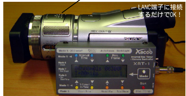
LANC端子に接続するだけでOK!