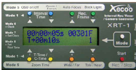
インターバル時間設定(例: 10秒) 録画フレーム数設定(例: 300フレーム)