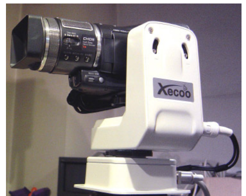
パン速度範囲: 1度/秒 ~ 15度/秒 チルト速度範囲: 0.75度/秒 ~ 7.5度/秒 パン可動範囲: 360度 チルト可動範囲: 90度 搭載可能カメラ重量: 2Kg

株式会社ゼクー Xecoo 〒577-0057 東大阪市足代新町4-10オキタビル3F TEL: 06-6783-4977 FAX: 06-6783-6995 E-Mail: info@xecoo.co.jp URL: http://www.xecoo.co.jp