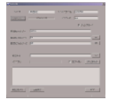
Xuploader 新規録画ファイルをFTPサーバーへ自動的に転送するためのソフトウェア