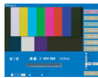
NXCapture 多機能/多用途 HDV/DVキャプチャー ソフトウェア