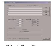
DiskRemKeeper 古いファイルを自動的に消去し、常に一定量のDisk空き容量を確保するためのソフトウェア